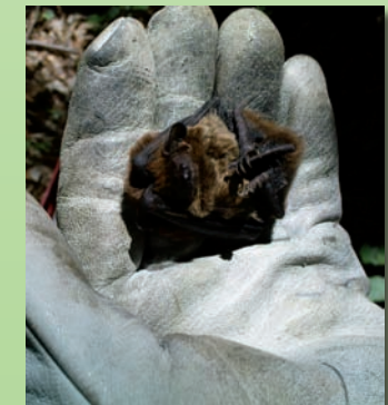
Kleiner Abendsegler