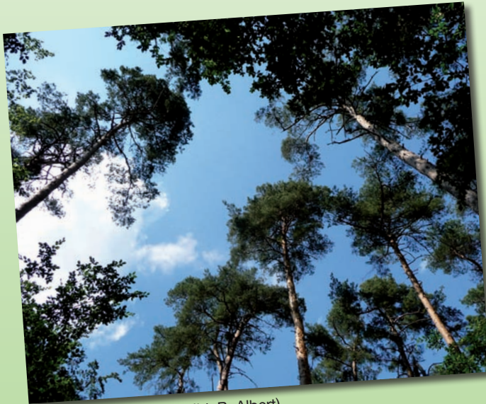
Waldimpression 2009

Am Wochenende vom 14. bis 17. Juni 2012 laden wir Sie bereits zum 9. Mal herzlich zum Hockenheimer Tag der Artenvielfalt ein. Dieses Jahr werden sich zwei weitere Projektgruppen der Lokalen Agenda 21 Hockenheim aktiv beteiligen. Die Gruppen „Begegnung Jung bis Alt“ sowie der „Oma-Opa-Service“ möchte mit Kindern und „Enkelkindern“ gemeinsam die Flora und Fauna im Wald erleben. Natürlich hat wie jedes Jahr die gesamte Hockenheimer Bevölkerung Gelegenheit, den Experten über die Schulter zu schauen, Fragen zu stellen sowie die interessanten Veranstaltungen zum Thema Natur zu besuchen.