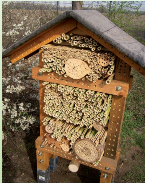
Insektenhotel (gebaut von Schülern der Theodor-Heuss-Realschule Hockenheim, Standort Muldhäusl seit 26.3.2012)

Darüber wurde in der Presse ausführlich berichtet.